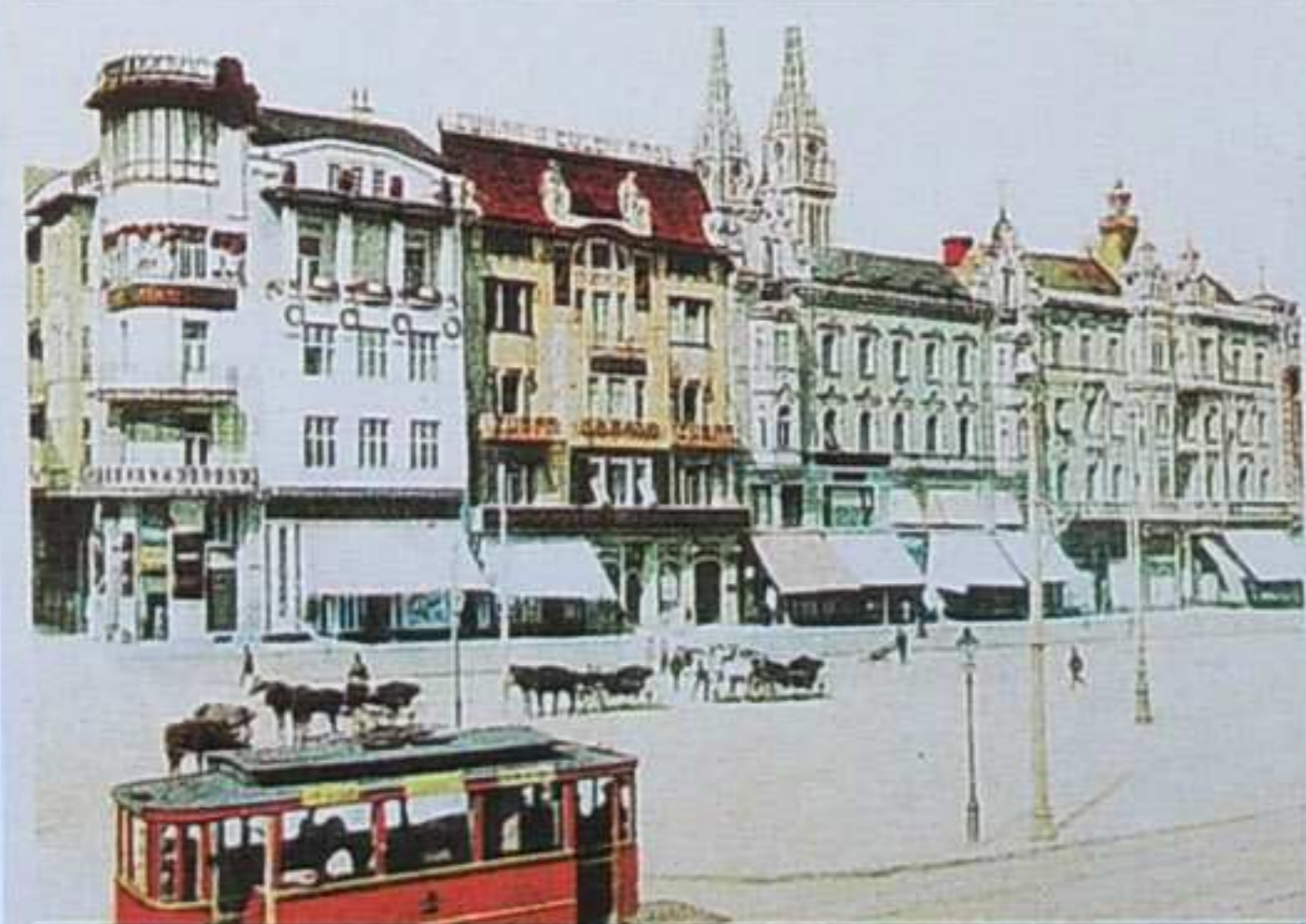
Trg bana Jelačića na starim razglednicama – početak 20. st.