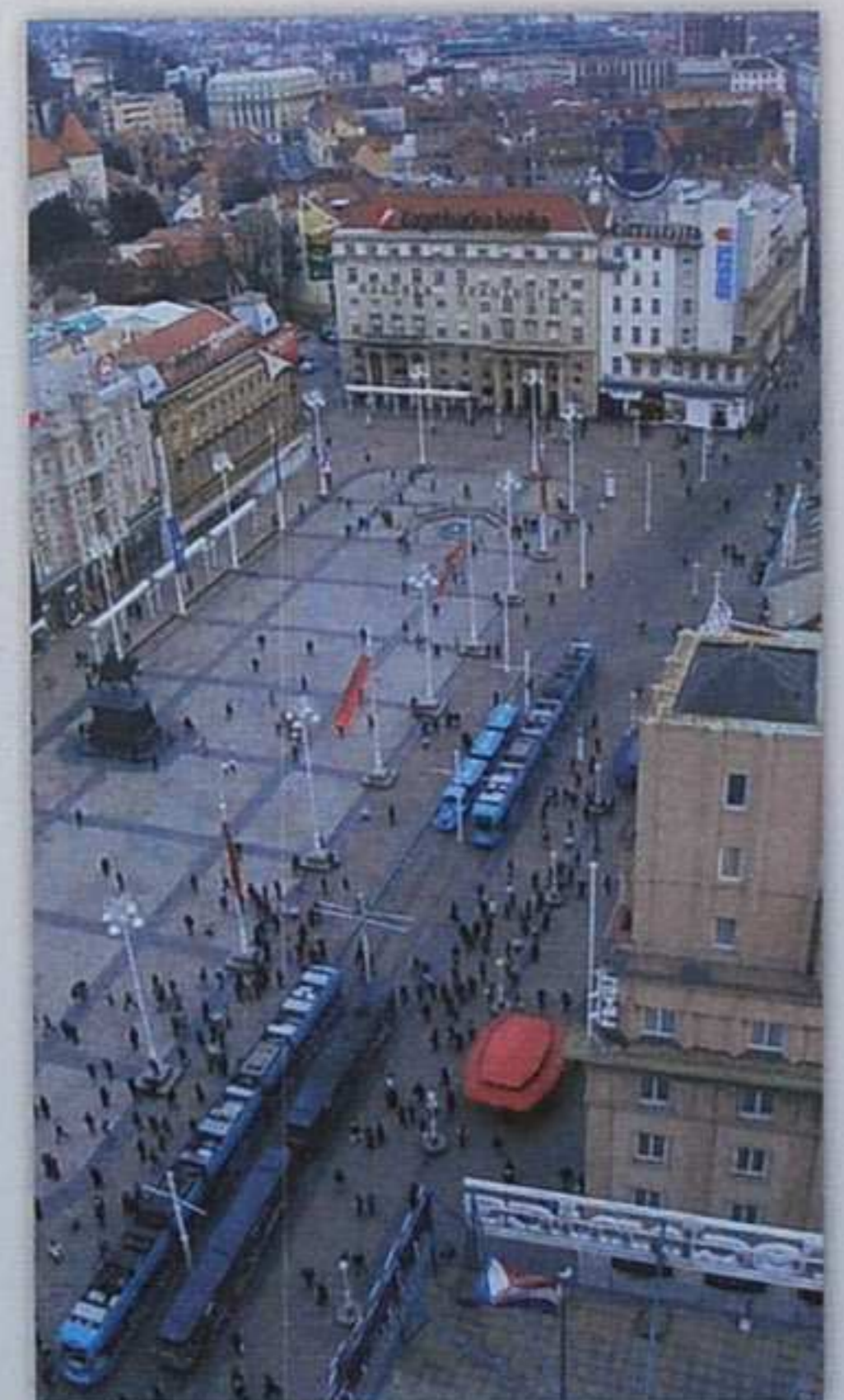
Trg bana Jelačića – početak 21. st.