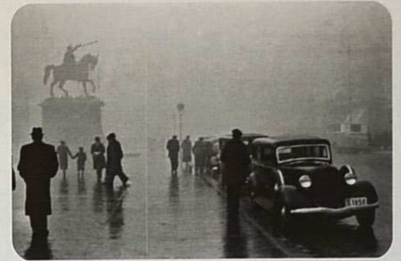
Automobili iz 30-god. 20. st. na Trgu bana Jelačića

Gradski se promet u Zagrebu intenzivno razvija u 20. st. Početkom stoljeća, Zagreb ima oko 60 000 stanovnika. Na njegovim ulicama se ponajviše pješaci, ali susrećemo konjanike, kočije i fijakere, konjske omnibuse (od 1844.) bicikle (od 1867.) i motor-kotače, konjski tramvaj (od 1891.) pokoji automobil (od 1899.). 1862. stigla je željeznica.