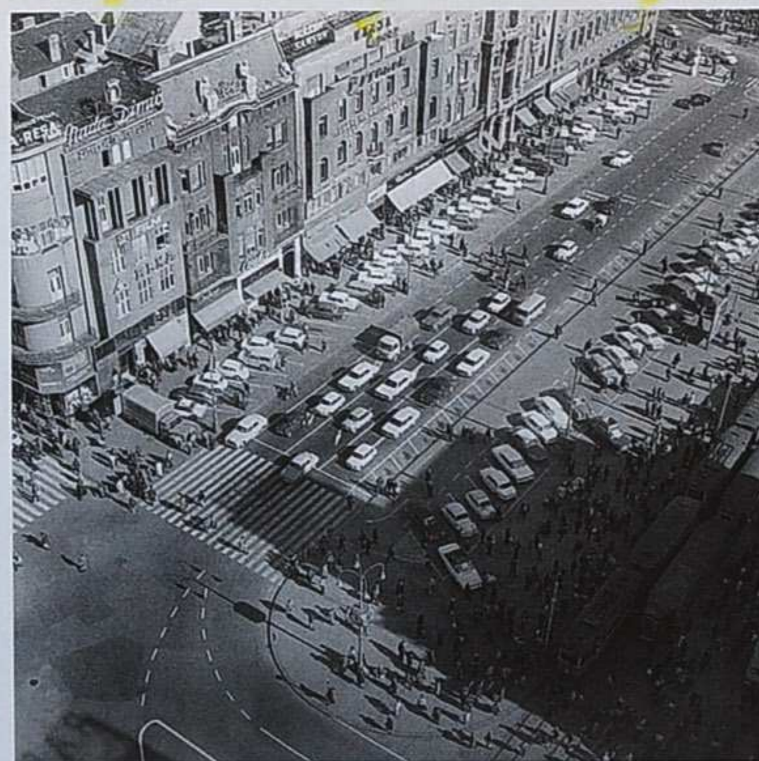
Sredinom 20. st. Trgom republike (Trg bana Jelačića) se vozi i parkira.