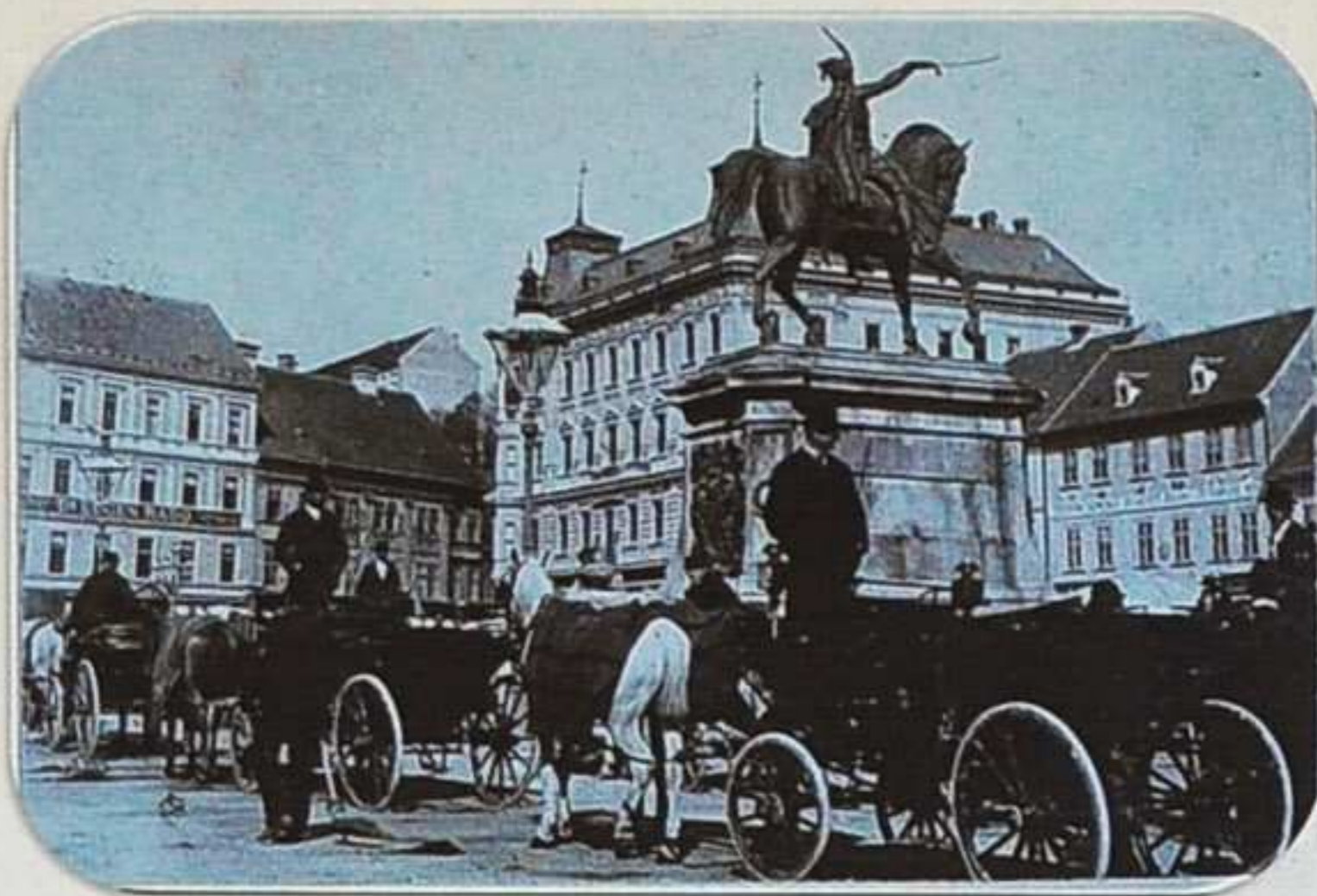
Trg bana Jelačića 1890.

Gradski se promet u Zagrebu intenzivno razvija u 20. st. Početkom stoljeća, Zagreb ima oko 60 000 stanovnika. Na njegovim ulicama se ponajviše pješaci, ali susrećemo konjanike, kočije i fijakere, konjske omnibuse (od 1844.) bicikle (od 1867.) i motor-kotače, konjski tramvaj (od 1891.) pokoji automobil (od 1899.). 1862. stigla je željeznica.