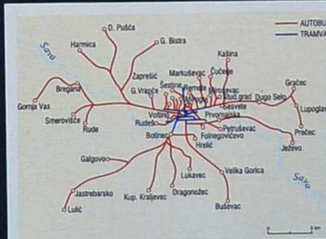
Autobusne linije u Zagrebu 1965.