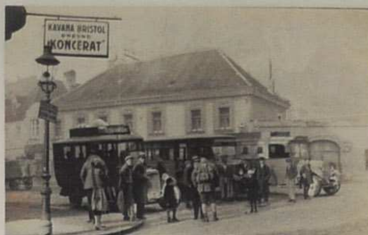
Autobusno stajalište u Vlaškoj za Šestine i Gračane oko 1929. (foto Vl. Horvat) MGZ, 18. 083