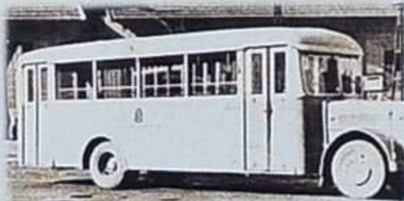
Autobus marke MAN 1941. a vozili su do 1957.

Nakon znatnih teškoća tijekom II. svjetskog rata, nastavlja se razvitak i unapređenje autobusnog prijevoza i to uvođenjem novih linija i poboljšanjem voznog parka.