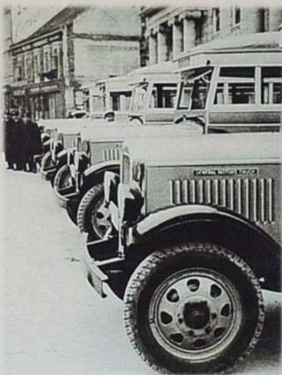
Autobusi marke Buick ispred Gradske štedionice na Trgu bana Jelačića

Na dodjelu koncesije se žali Gradska općina i Gradska štedionica, a kako je njihova žalba prihvaćena tvrtka Barešić je prisiljena prodati autobuse Gradskoj štedionici.