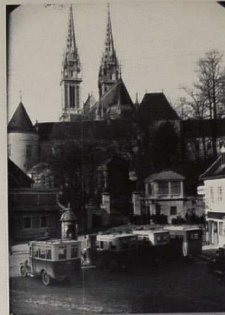
Stajalište autobusa u Branjugovoj oko 1925./27.