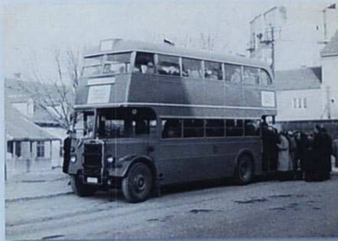
Autobus Črnomerac – Podsused, 1955. MGZ 6403

Nakon znatnih teškoća tijekom II. svjetskog rata, nastavlja se razvitak i unapređenje autobusnog prijevoza i to uvođenjem novih linija i poboljšanjem voznog parka.