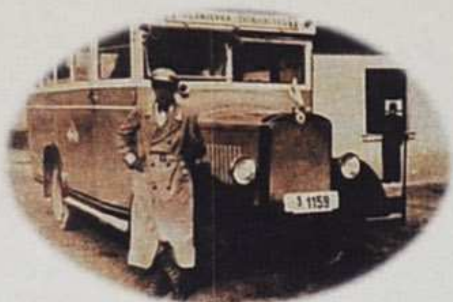
Autobus na liniji Zrinjski trg –Trešnjevka

Vozni park : 3 autobusa marke Lancia kapacitet: 30 putnika boja autobusa : siva