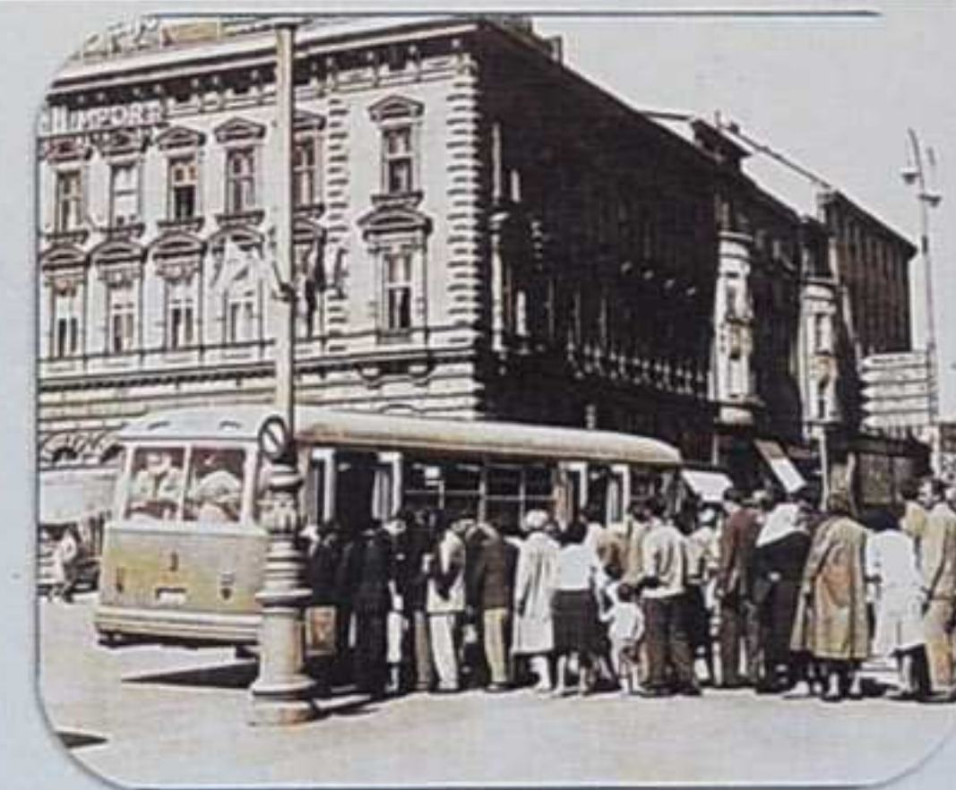
Autobusno stajalište na Trgu bana Jelačića